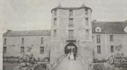
Le château de Villiers-le-Mahieu accueille de nombreux mariages.

Pour un mariage traditionnel et élégant : l'abbaye des Vaux-de-Cernay, le château de Méridon à Chevreuse, le château de Breteuil, le château des Clos à Bonnelles, le château de Mauvières à Saint-Forget.